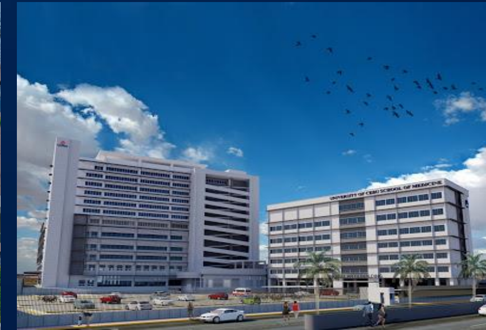
UCEMED & CHONGHUA